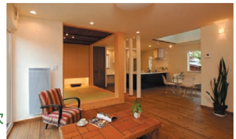
無害で安全なため吹きつけ作業も簡単

このトリニティー作用を生かした環境改善水を住宅施工に使用、1カ月でホルムアルデヒド濃度が98%も減衰したという。また同社では、トリニティーを扱う代理店を業界問わず募集している。詳細は問い合わせを。