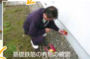
基礎鉄筋の有無の確認