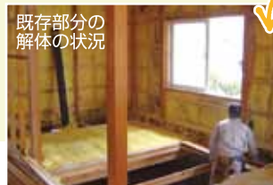
既存部分の解体の状況