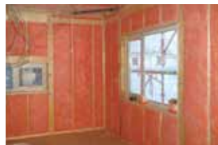
断熱工事(あらためて断熱材を施工)