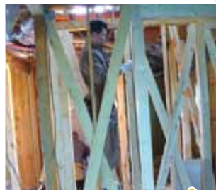
耐震工事(筋交いの追加)